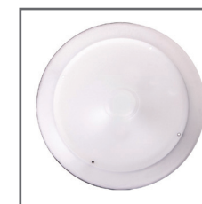
daszek do oprawy - biały