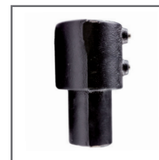
redukcja słupa - stalowa, czarna